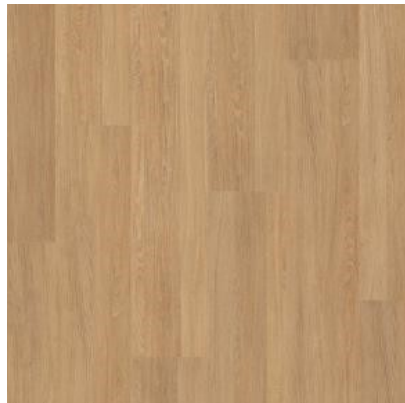
ESSENCIAL OAK FPR1577