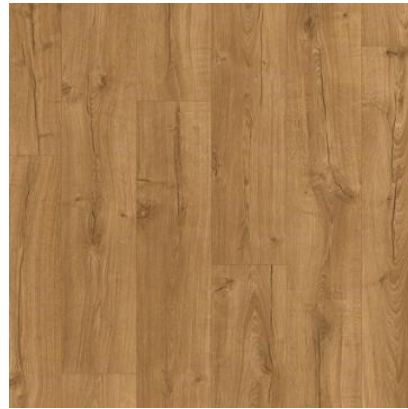
CARVALHO CLÁSSICO NATURAL IM1848