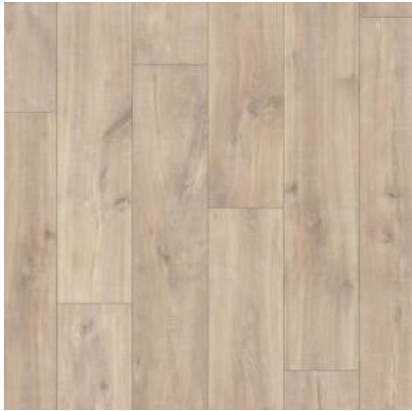
CARVALHO NATURAL HAVANA COM MARCAS DE SERRA QSMN1656