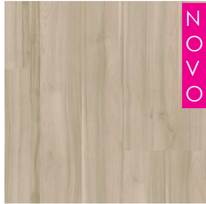
MIRACOSA JERSEY QSMN1533