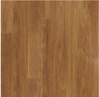
CUMARU TEFÉ FVIW1666