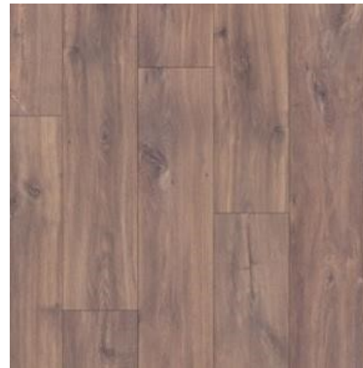
CARVALHO ESCURO MIDNIGHT QSMN1488