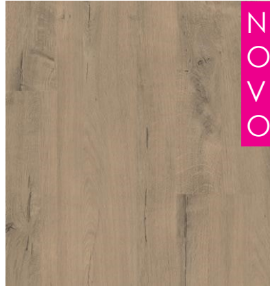
NEW PEGASUS FPR 0316