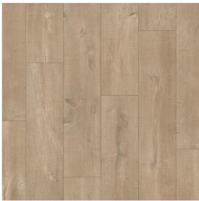
CARVALHO CLARO SERRADO QEWN3676