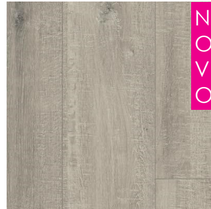
CARVALHO ACINZENTADO COM CORTES DE SERRA QEWN 3680