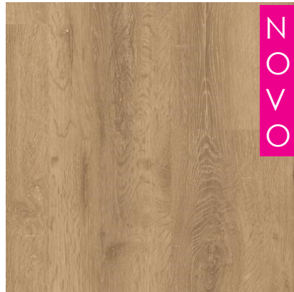
NOVO CARVALHO EVEREST QSMN0314