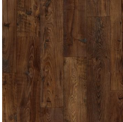
CASTANHEIRO ESCURO RESTAURADO QEWN3785