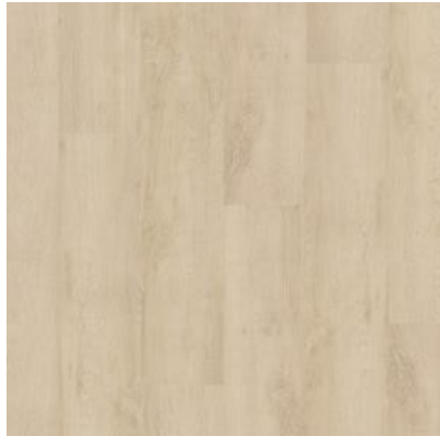
CARVALHO SACRAMENTO FPR034