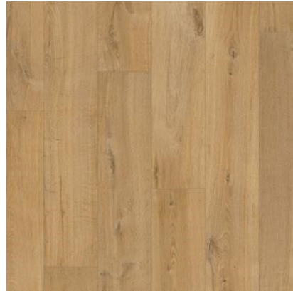
CARVALHO NATURAL SOFT IM1855