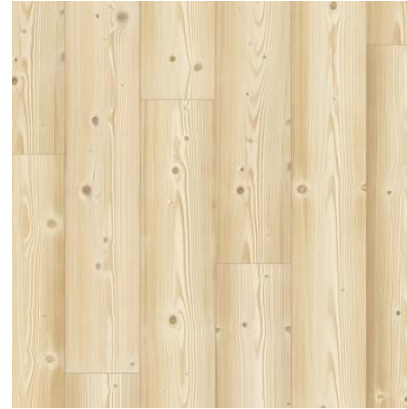
PINUS NATURAL IM1860