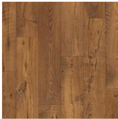
CASTANHEIRO ANTIGO RESTAURADO QEWN3786