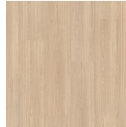
CARVALHO VANILLA QSMN2676