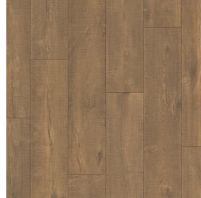
CARVALHO DESERTO RESTAURADO QEWN3678