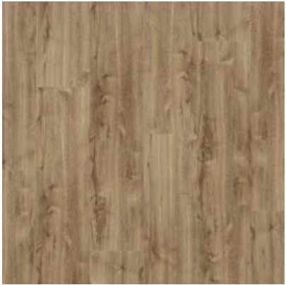
NEW OAK FPR1574