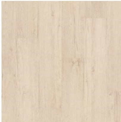
PÁTINA COTTAGE QSMN5001