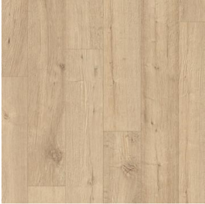
CARVALHO AREIA NATURAL IM1853