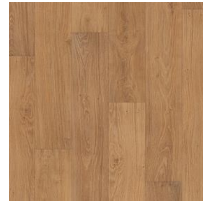
CARVALHO NATURAL ENVERNIZADO QSMN1292