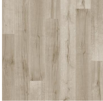
CARVALHO PASTIS FVIW1611