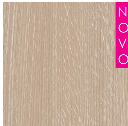
CARVALHO STUDIO FVIW1463