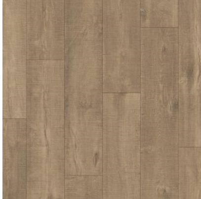
CARVALHO CAFÉ RESTAURADO QEWN3679