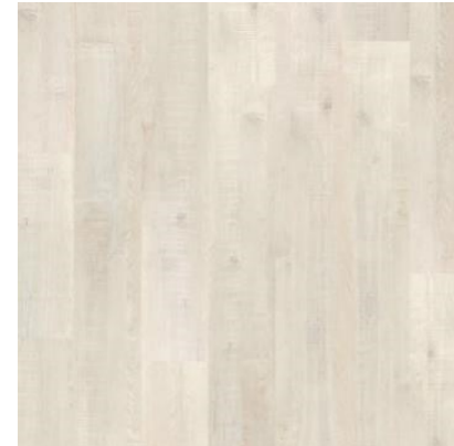
CARVALHO ANDES FVIW866