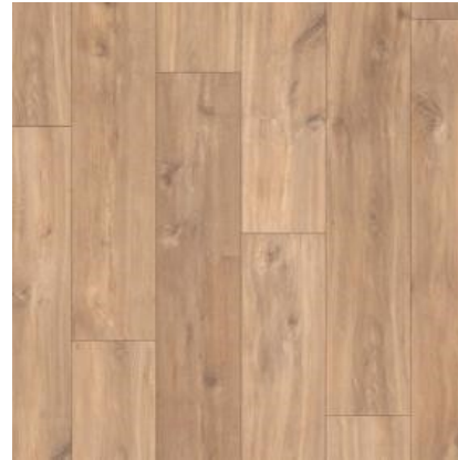
CARVALHO NATURAL MIDNIGHT QSMN1487