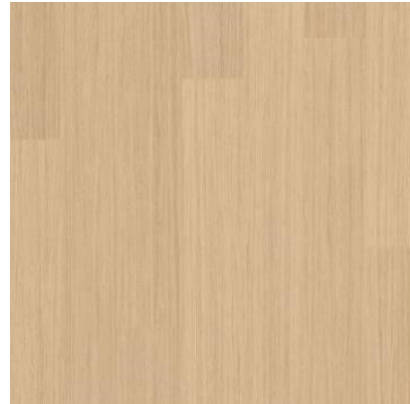
CARVALHO SERENO FVIW851