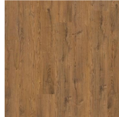
CARVALHO AGRESTE FVIW1464