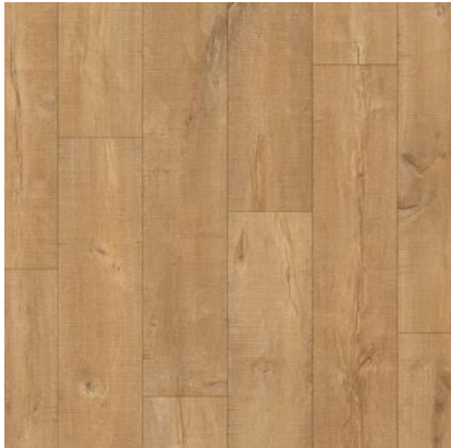
CARVALHO NATURAL SERRADO QEWN3677