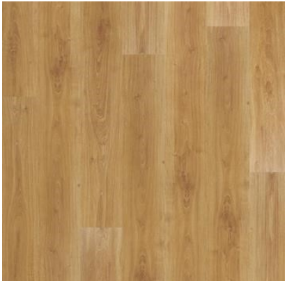
CARVALHO VITORIANO FVIW1462