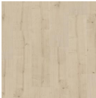
NOVARA ALLOVER FPR037