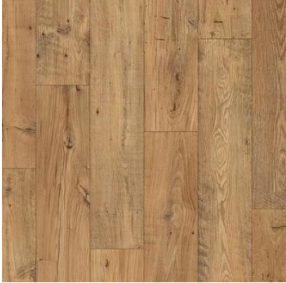
CASTANHEIRO NATURAL RESTAURADO QEWN3784