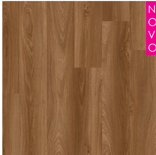
MAIORCA FALN 3052