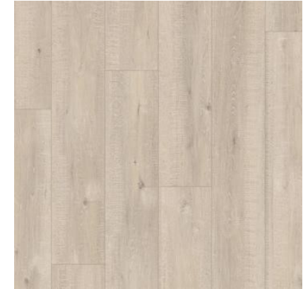
CARVALHO BEGE SERRADO IM1857