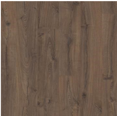
CARVALHO MARROM CLÁSSICO IM1849