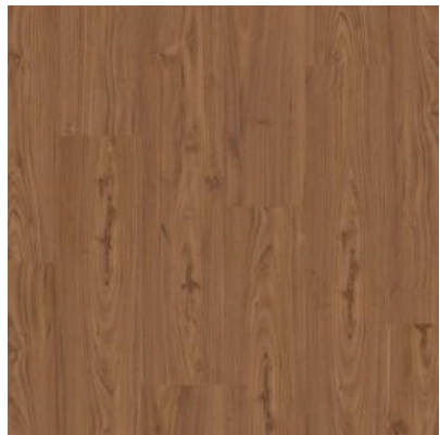
IPÊ ÁBANO FPR8005