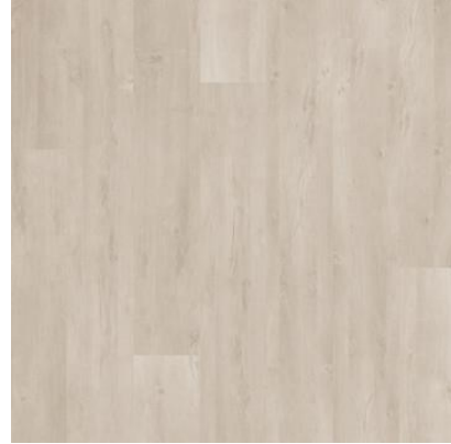
CARVALHO CUBANO FVIW877