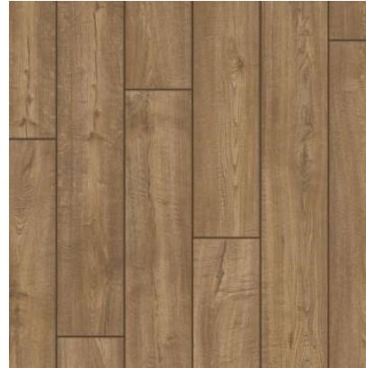
CARVALHO MARROM ACINZENTADO IM1850